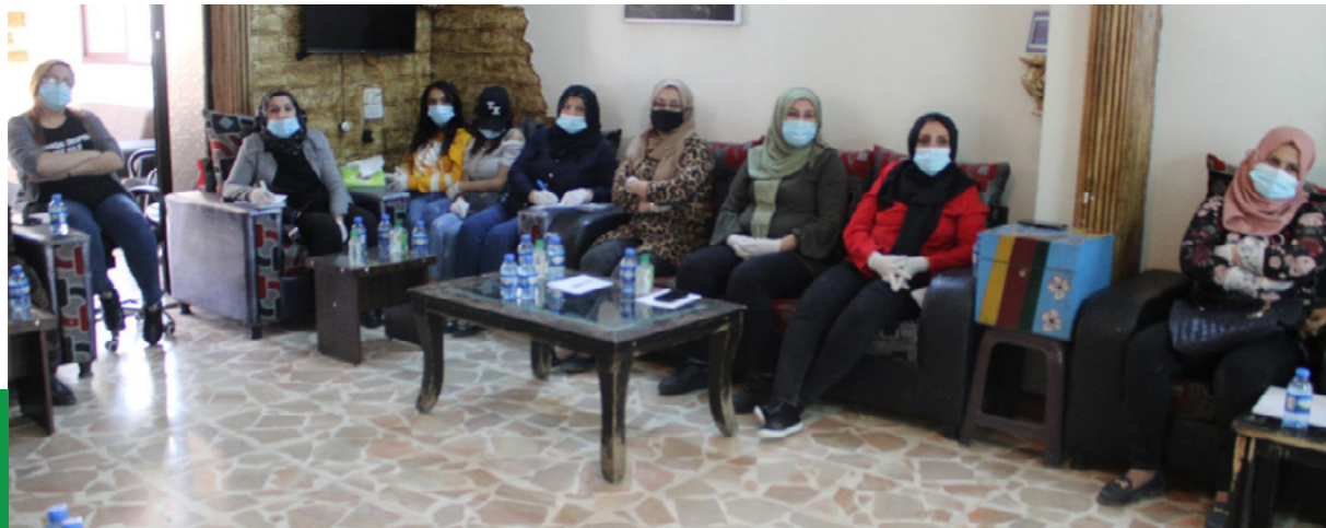
Photos d'une éducation inter- ne