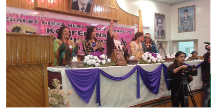
Photo de la Conférence des Mala Jin - 2016

La structure du Mala Jin a été abordée dans de nombreux articles et documents de recherche, mais cer-