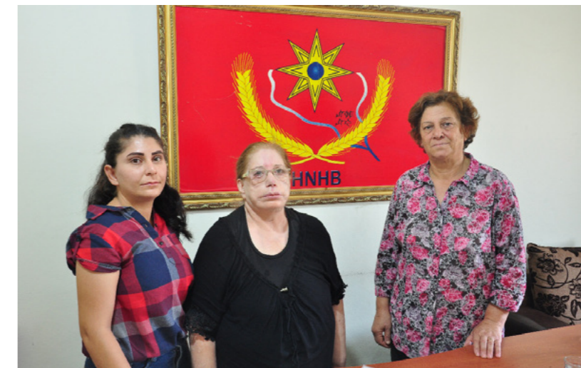
Membres de la Mala Jin syriaque d' Heseke

Cet exemple illustre la capacité des différentes communautés du Nord et de l'Est de la Syrie à intégrer un projet tel que le Mala Jin qui fonctionne au bénéfice de l'ensemble.