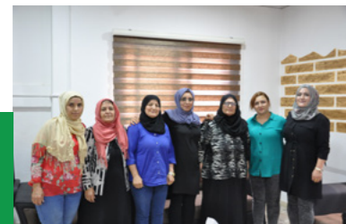
Membres du centre Mala Jin de Qamishlo

La première Mala Jin a officiellement ouvert ses portes à Qamishlo le 20 mars 2011. Mais comme nous l'avons vu plus haut, des décennies d'organisation clandestine par les femmes kurdes a permis de poser les bases d'un travail dont l'objectif reste de construire une véritable égalité au sein de leurs familles et de leurs quartiers. La Mala Jin est