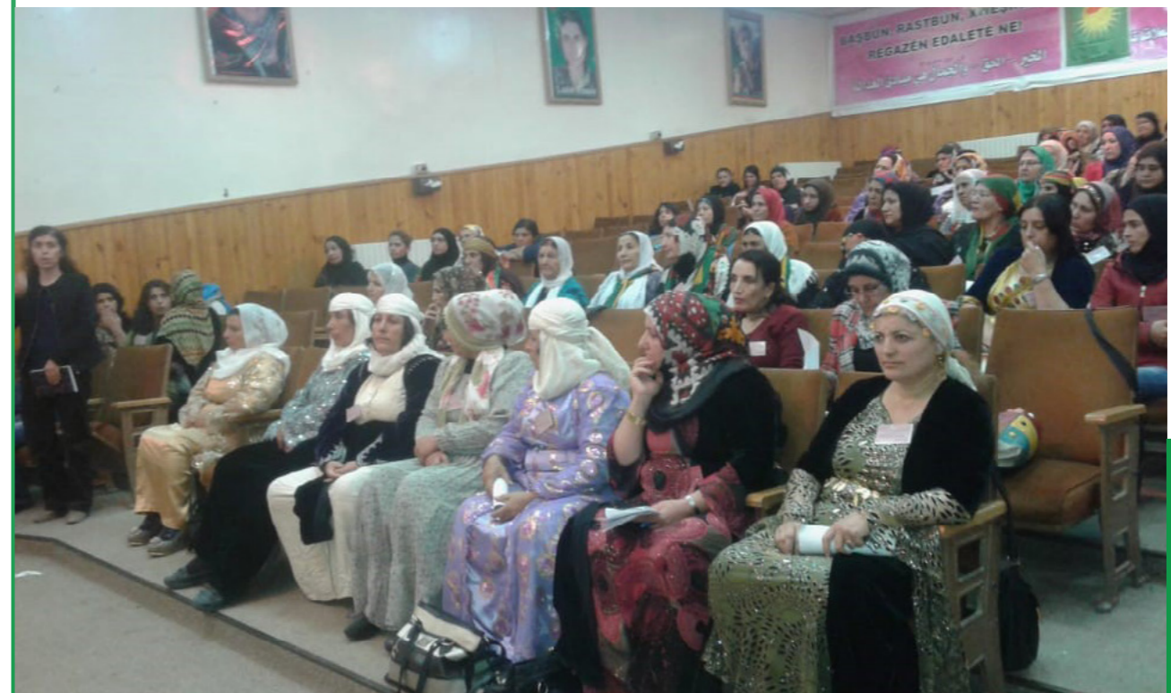
Photo de la première conférence des Mala Jin (2016) avec la participation de 135 représentantes des Mala Jins de Cizire, Afrin, Kobane, Damas, Manbij

Cependant, comme nous l'avons vu plus haut, le tribunal est impliqué dans l'approbation et le dépôt des contrats d'accord pour de nombreux autres types d'affaires, telles que celles liées au divorce. Le tribunal rendra le jugement officiel et définitif du divorce, mais les conditions de médiation de la plupart des divorces seront dictées par la procédure du Mala Jin. Si la médiation avec le Mala Jin n'aboutit pas et qu'aucun accord ne peut être trouvé, le Comité de réconciliation sociale sera consulté. En cas de nouvel échec de la médiation, le tribunal reprendra l'affaire pour régler le divorce.