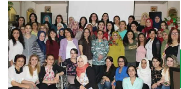
Conférence des Mala Jin - 10 octobre 2016

Kongra Star, qui s'appelait à l'origine Yekitiya Star 2 , a été fondée en 2005 en tant qu'organisation clandestine de femmes majoritairement kurdes opérant sous le régime Baasiste. Ces premières années furent difficiles et dangereuses pour les femmes impliquées dans l'organisation, les militantes étant prises pour cible par les forces de sécurité, arrêtées, et même torturées. Cependant, l'organisation réalisée par les membres de Yekitiya Star sous le régime Baasiste a constitué une base solide pour agir lorsque la crise syrienne a éclaté. Dès le premier jour de la révolution, Yekitiya Star a joué un rôle clé dans l'organisation et l'intégration à tous les niveaux administratifs dans la région, devenant l'un des principaux mouvements politiques de la région, et mettant l'accent sur l'importance de l'autonomisation des femmes et de l'action politique dans la libération. Ce mouvement débutera tout d'abord principalement avec les femmes kurdes, mais grandira pour inclure des femmes de toutes les ethnies et religions. En 2016, Yekitiya Star change de nom pour devenir Kongra Star, devenant ainsi une organisation faitière de toutes les structures et institutions de femmes acceptant de travailler dans le cadre de sa charte. En outre, lorsque les régions à majorité arabe de Manbij, Tabqa, Raqqa et Deir ez Zor ont été libérées d'ISIS et intégrées au projet AANES, les femmes arabes ont constaté qu'elles