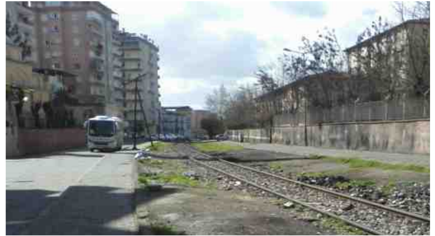
voie ferrée en centre-ville de Diyarbakir - photo N.P, mars 2015

Le 8 mars dernier, on était à Muş (est de la Turquie) pour faire un état des lieux des femmes à l'université. Il y avait un homme, qui était le représentant de la section d'Eğitim Sen. Il nous a expliqué que ce qui comptait c'était la lutte des classes et qu'il fallait pas se diviser. C'était un panel pour le 8 mars, même le 8 mars, on peut pas parler en temps que femme. Il y a une solidarité entre les hommes de tous les partis.»